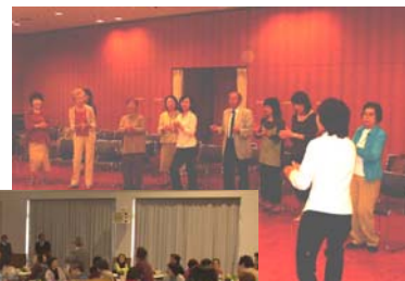
高齢者のための音楽療法