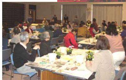
高齢者のための園芸療法

◇介護方法を学ぶ研修会(H15)、高齢者のための音楽療法、高齢者のための園芸療法を学ぶ研修会を実施(H16)（ビジョン委員会活動）